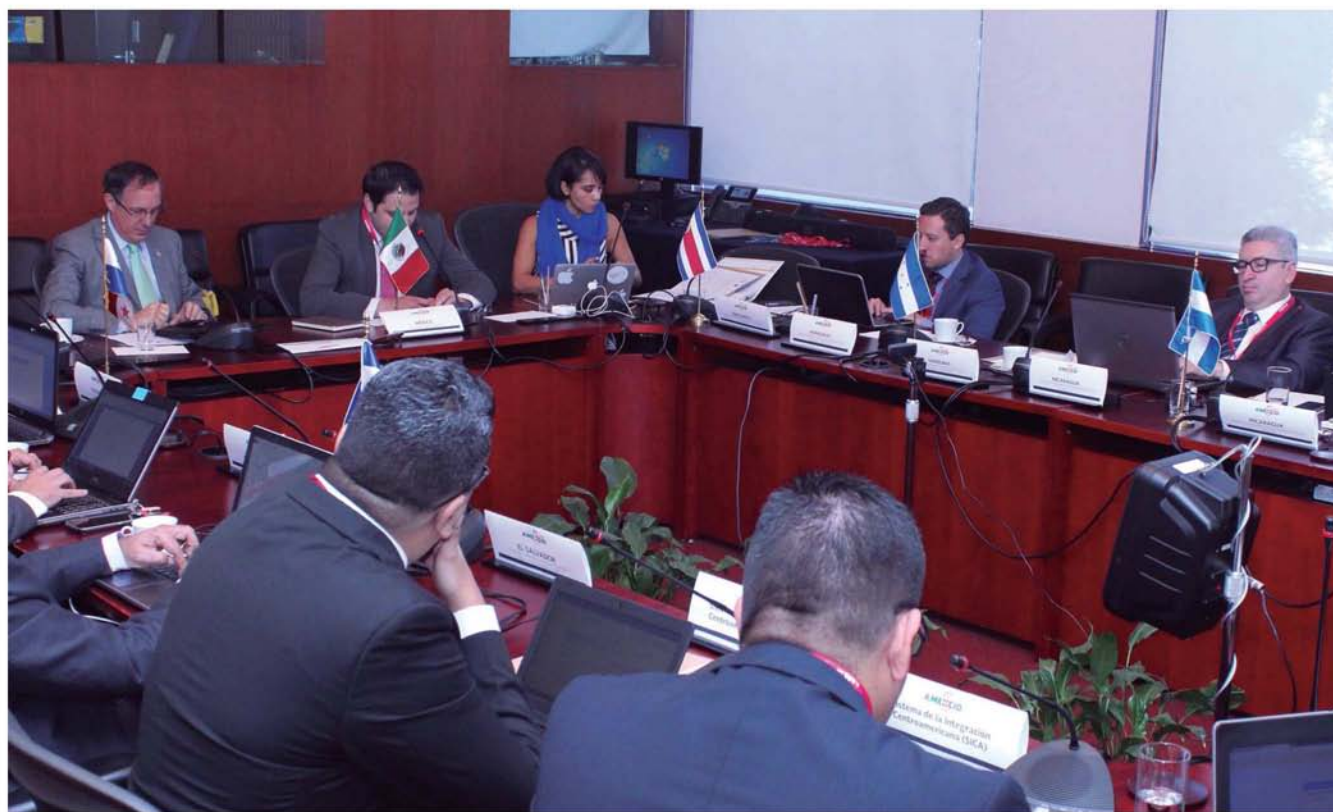
Taller de Trabajo Mercado Digital Regional, países de Centroamérica, noviembre 2016.

El 7 y 8 de noviembre 2016 , en las instalaciones de la Cancillería de México y con el apoyo de AMEXCID (Agencia Mexicana de Cooperación para el Desarrollo), se llevó a cabo el taller “Mercado Digital Regional” eLAC2018. El objetivo fue compartir con los países de Mesoamérica la experiencia del Grupo de Trabajo de MDR y escuchar las necesidades de los países de esta región para incorporarse de manera más activa en el mecanismo de cooperación regional eLAC2018.