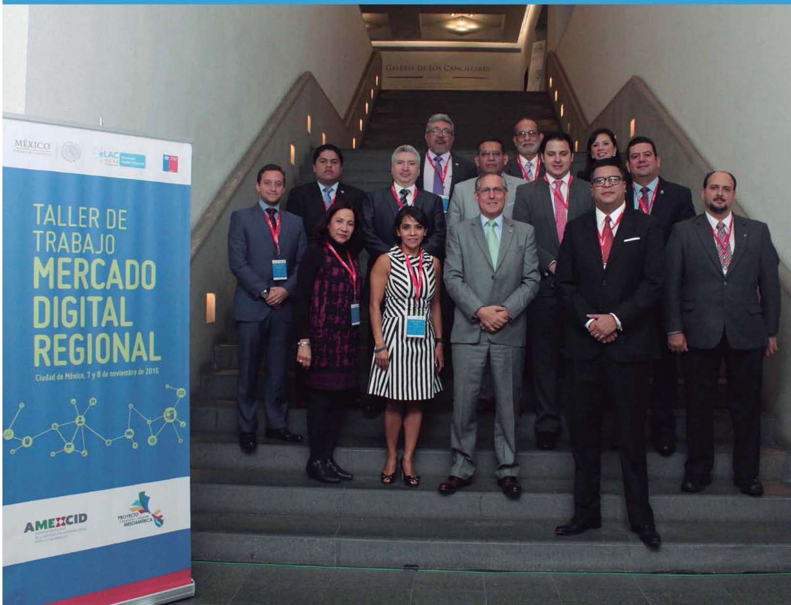
Taller de Trabajo Mercado Digital Regional, países de Centroamérica, noviembre 2016.