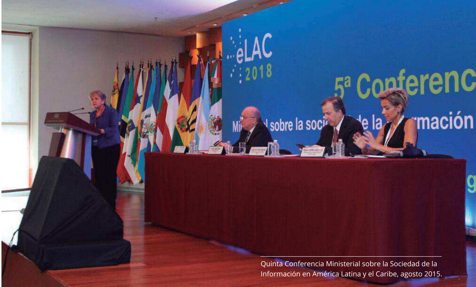
Quinta Conferencia Ministerial sobre la Sociedad de la Información en América Latina y el Caribe, agosto 2015.

La CEPAL en el documento la Nueva Revolución digital , presentado durante la Quinta Conferencia Ministerial sobre la Sociedad de la Información en América Latina y el Caribe, reconoció la importancia de promover mayor integración comercial en materia digital así como de la creación de un mercado digital regional , resaltando que estos tipos de estrategias pueden contribuir a ampliar la escala y desarrollar economías de red para competir en un mundo de plataformas globales. Un espacio idóneo para discutir estos temas es la plataforma provista por la Agenda digital eLAC2018, particularmente por el Grupo de Trabajo de Mercado Digital Regional (MDR).