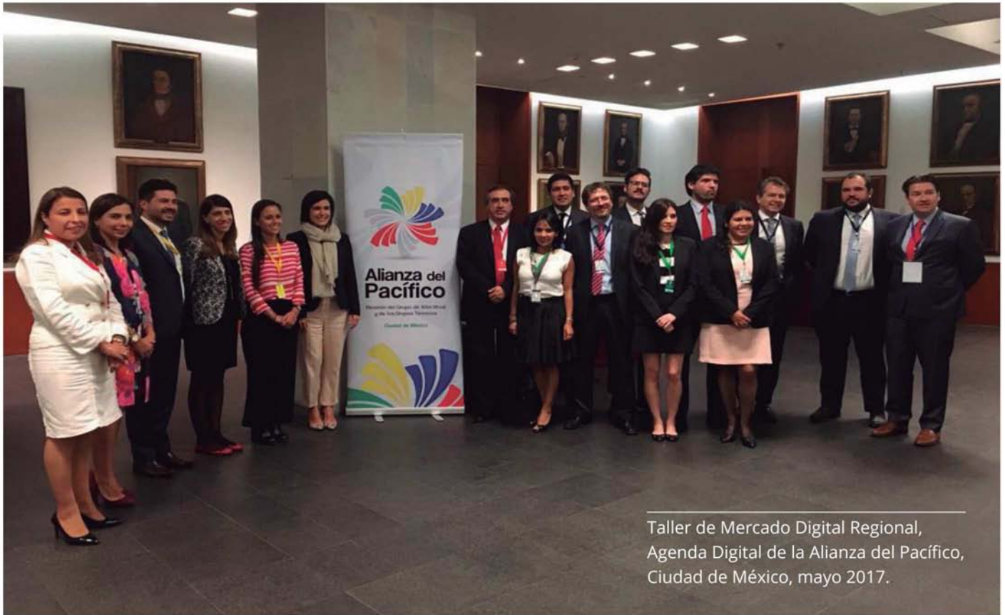
Taller de Mercado Digital Regional, Agenda Digital de la Alianza del Pacífico, Ciudad de México, mayo 2017.